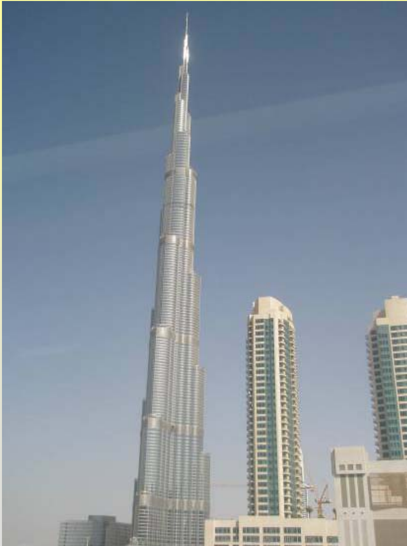
Burj Khalifa Tower, Dubai, UAE